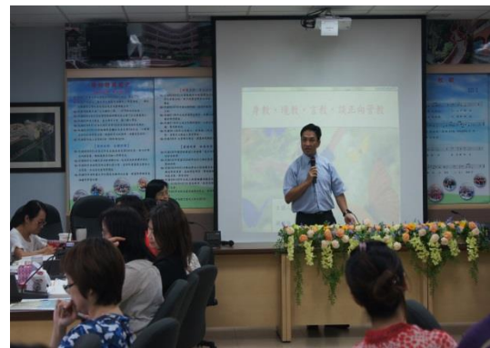
三玉國小 身教境教言教談正向管教