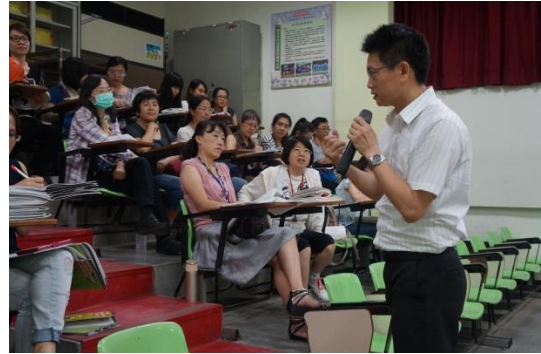
康寧國小 聰明老師有絕招—人權教育