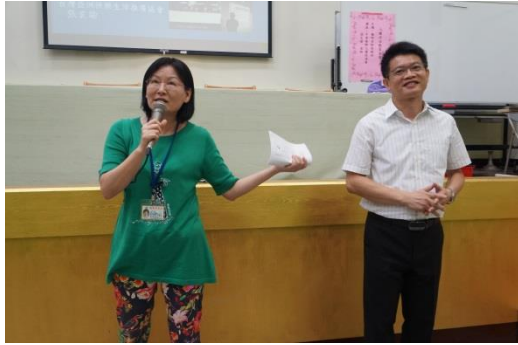
康寧國小 聰明老師有絕招—人權教育