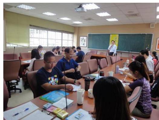
政大實小 聰明老師有絕招-人權教育