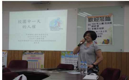
文湖國小 學校的一天：談校園常見的人權問題