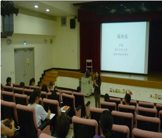
信義國小 洪蘭教授 腦與惱