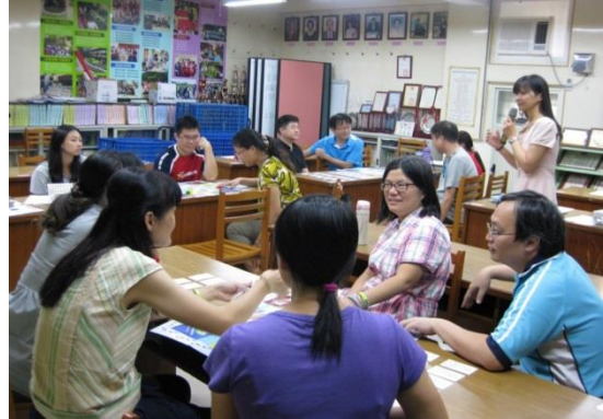
華江國小 人權法治-兒童權利公約