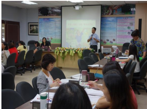
三玉國小 身教境教言教談正向管教