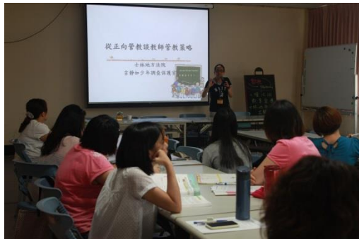
景美國小 從正向管教談教師管教策略