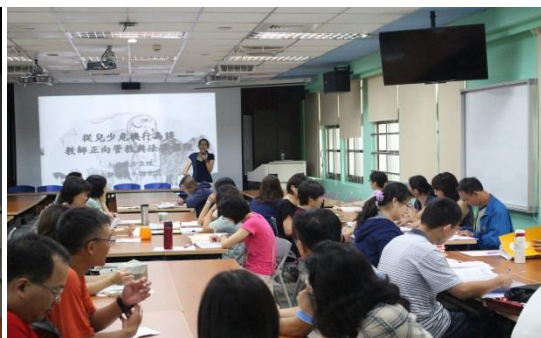
建安國小 從兒少危機行為談教師之法治權限