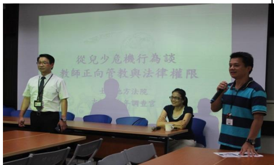
建安國小 從兒少危機行為談教師之法治權限