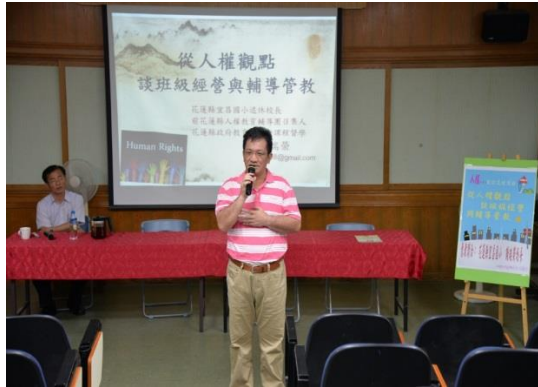
永吉國小 從人權觀點談班級經營與輔導管教